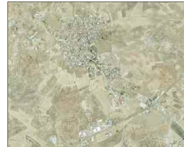
Aprobado Definitivamente por la Comisión Provincial de Urbanismo de Toledo, en sesión celebrada el día 09 de Mayo de 2007